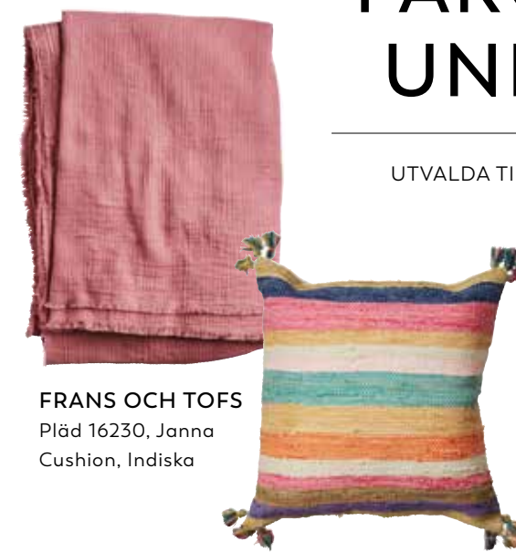
FRANS OCH TOFS Pläd 16230, Janna Cushion, Indiska

UTVALDA TIPS OCH GODBITAR SOM GÖR LIVET PÅ FAVORITPLATSEN ALLDELES UNDERBART. UT OCH NJUT!