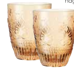
KULÖRT TILL BORDS Lemonade Amber, Gahan Wood Bowl, Indiska

GÖR SÅ HÄR: Häll björnbärssaft i ett glas. Fyll på med alkoholfri torr äppelcider eller mousserande vin. Lägg i isbitar. Garnera med några björnbär och en limeklyfta.