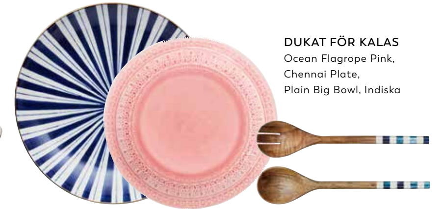
DUKAT FÖR KALAS Ocean Flagrope Pink, Chennai Plate, Plain Big Bowl, Indiska