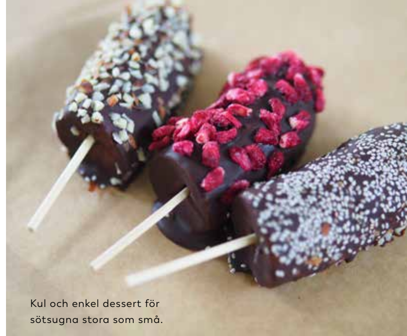
Kul och enkel dessert för sötsugna stora som små.

GÖR SÅ HÄR: Smält den mörka chokladen på låg värme eller gör vattenbad. Dela bananen på mitten och doppa i chokladen. Lägg bananerna på bakplåtspapper och strö över topping och stick i en glasspinne eller grillpinne. Ställ in i frysen ca 30 minuter.