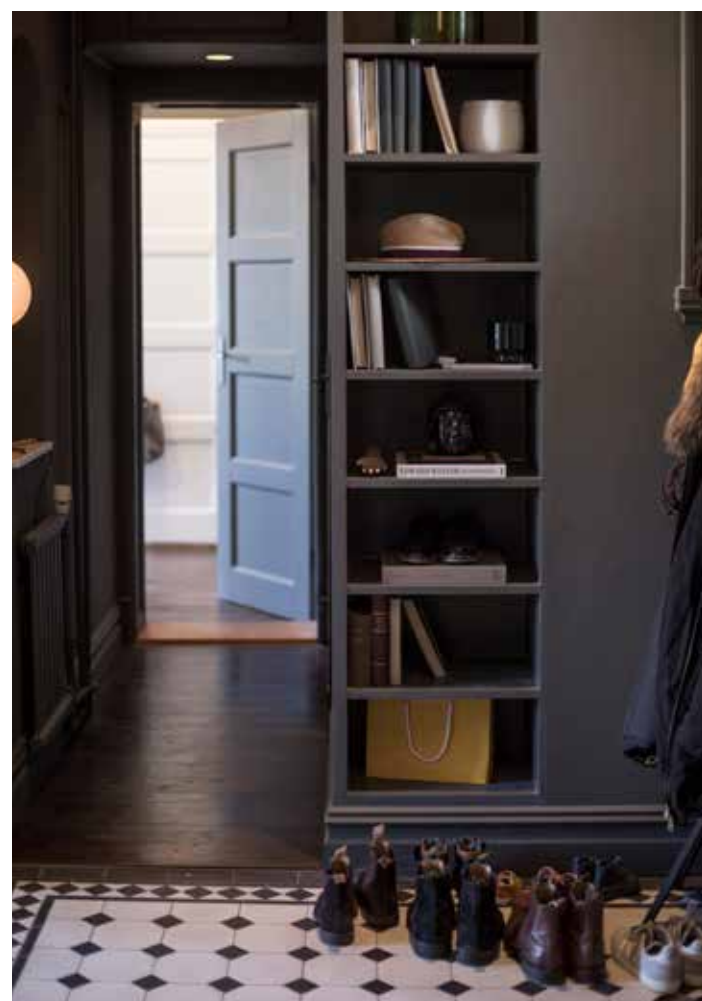
Det fina klinkergolvet i rutigt svart och vitt sätter en personlig prägel på hallen.