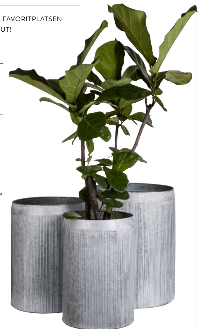
PLANTERA PÅ HÖJDEN Tunna i zink i 3 storlekar, Granit