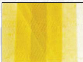
Vikveck. Taittovekki. Kritt effekt. Foldemærker