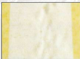
Skrynkelmärken mitt på våden. Ryppyjuälkiä kankaan keskellä. Bølgegang. Rynker midt på dugen.

Tekniske tekstiler har nogle kendetegn, som til trods for stor omhyggelighed i design og produktion, kan virke som fejl i vævningen. Det kan således føre til klager og reklamationer. Men disse fejl påvirker ikke dugens levetid. Folder eller rynkemærker som disse kan ikke undgås. De opstår oftest dér, hvor dug-banerne er syet sammen eller bukket om. På disse steder er dugen dobbelt så tyk som ellers og fylder derfor mere. Det er simpelthen årsagen – og alle duge gør sådan. Det synes blot mere på ensfarvede duge. De Du kan se eksempler på disse fænomener på fotografierne. Der er altså ingen grund til at reklamere over dette.